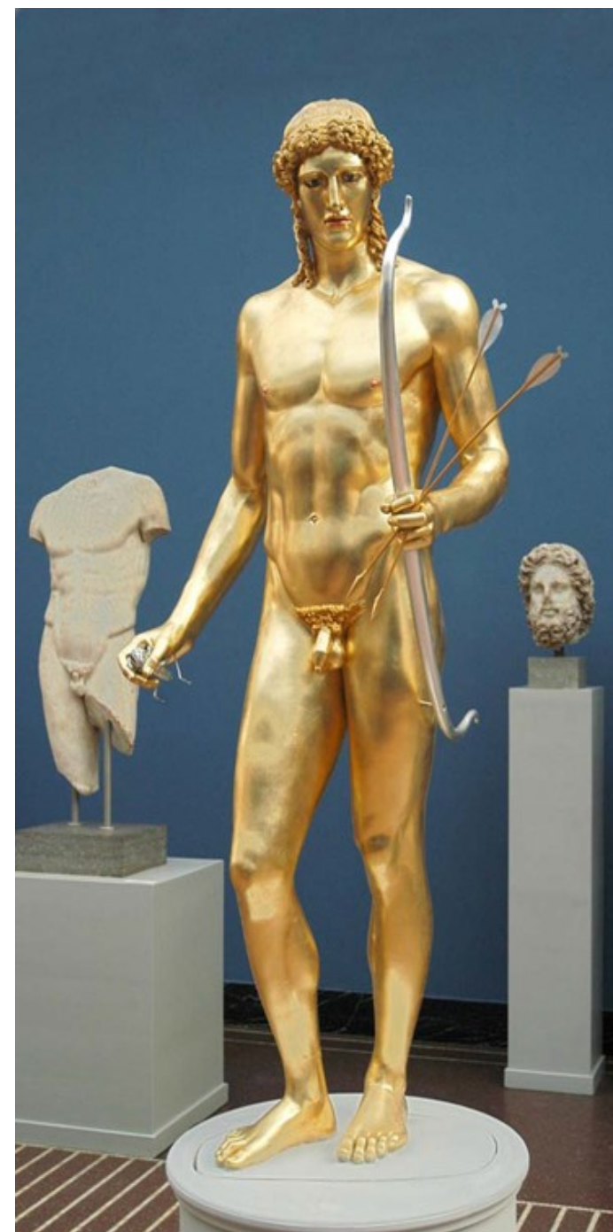
Apollon. Fra Glyptotekets udstilling ClassiColor

Matematiske tegn og geometriske læresætninger som \pi , Pythagoras' sætning og Archimedes' lov