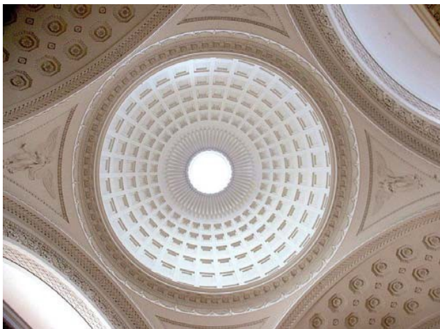
Christiansborg Slotskirke