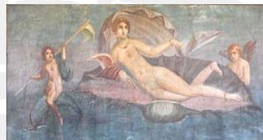
Venus. Vægmaleri fra Pompeii

ARKITEKTUR BIBLIOTEK BIOLOGI CYKLUS DEMOKRATI DRAMA ETIK FILOSOFI FYSIK GEOGRAFI GYMNASIUM HISTORIE HUMANIORA JURA KULTUR LOGIK MATEMATIK MEDICIN MUSIK NAVIGATION OPERA POESI PSYKOLOGI POLITIK REPUBLIC RETORIK STADION SYMFONI TEORI ZOOLOGI ÆSTETIK ØKONOMI