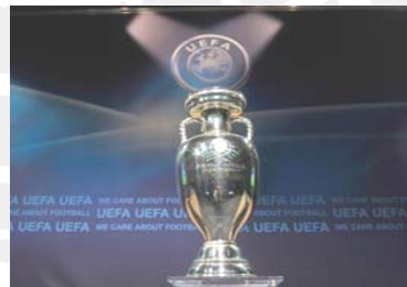
Fodboldpokal udformet som græsk vase