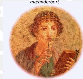
Ung pige fra Pompeii