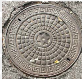
Københavns kloakdæksel med mæanderbort