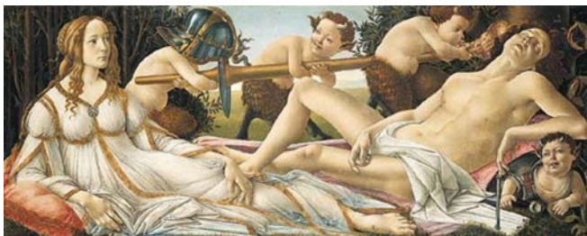
Botticelli: Venus og Mars

På hjemmesiden www.antikkensvenner.dk kan du finde yderligere oplysninger om foreningen, hvorledes du bliver medlem, samt kontingent. Her finder du også oplysninger om aktuelle arrangementer