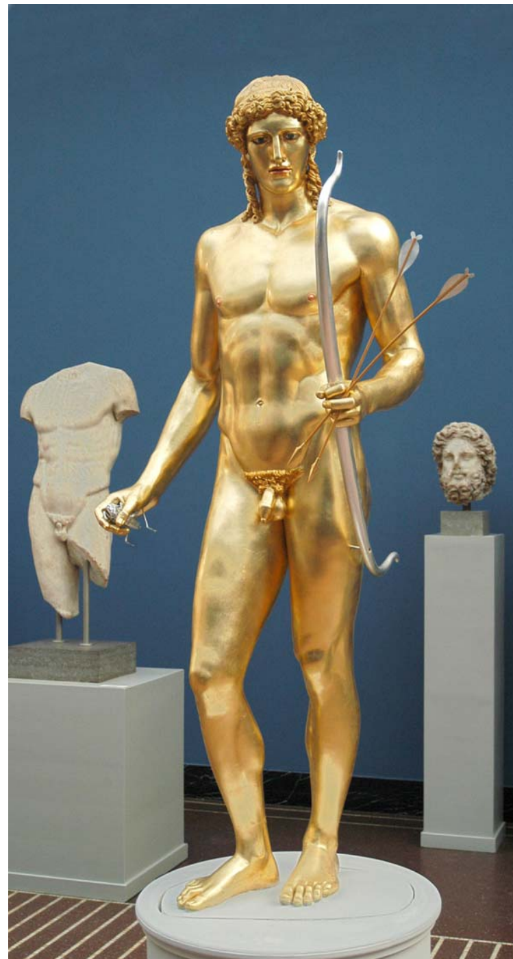
Apollon. Fra Glyptotekets udstilling ClassiColor

Matematiske tegn og geometriske læresætninger som \pi , Pythagoras' sætning og Archimedes' lov.