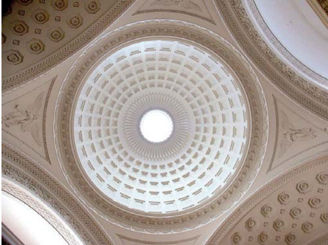
Christiansborg Slotskirke

Vi kalder den oldtiden . I virkeligheden taler vi om Europas ungdom . I vores hverdag møder vi konstant eksempler på oldtidens indflydelse. I arkitektur, billedkunst, sproget med mere.