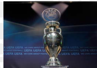
Fodboldpokal udformet som græsk vase