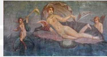
Venus. Vægmaleri fra Pompeii

ARKITEKTUR BIBLIOTEK BIOLOGI CYKLUS DEMOKRATI DRAMA ETIK FILOSOFI FYSIK GEOGRAFI GYMNASIUM HISTORIE HUMANIORA JURA KULTUR LOGIK MATEMATIK MEDICIN MUSIK NAVIGATION OPERA POESI PSYKOLOGI POLITIK REPUBLIC RETORIK STADION SYMFONI TEORI ZOOLOGI ÆSTETIK ØKONOMI