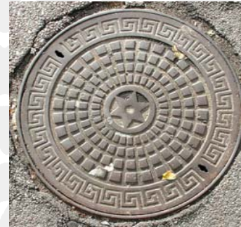
Københavns kloakdæksel med meanderbort