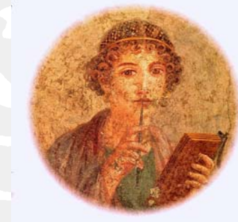
Ung pige fra Pompeii