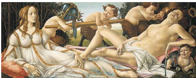
Botticelli: Venus og Mars

På hjemmesiden www.antikkensvenner.dk kan du finde yderligere oplysninger om foreningen, hvorledes du bliver medlem, samt kontingent. Her finder du også oplysninger om aktuelle arrangementer.